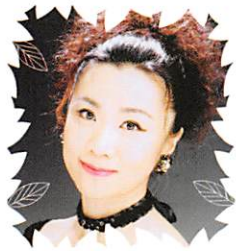
選帝侯妃マリー 里中トヨコ