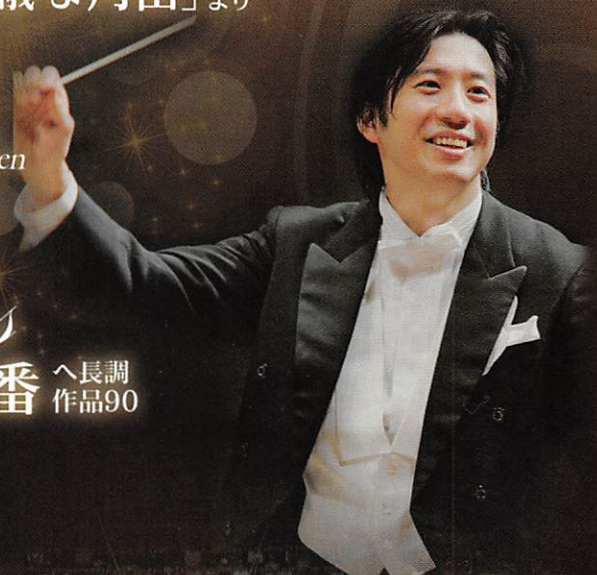
指揮 | 海老原 光